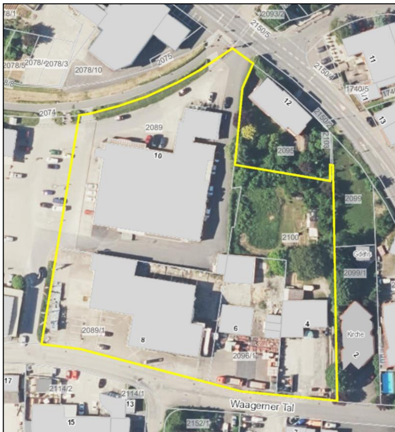
Luftbild Bestand (M 1:1.500)

Im Nordwesten bezieht der Geltungsbereich ein Gartengrundstück mit ein. Der Bereich hinter dem Getränkemarkt wirkt noch einigermaßen gepflegt, der westliche Bereich liegt brach und wächst mehr und mehr zu. An Gehölzen ist insbesondere ein größerer Walnussbaum hinter dem ehem. Getränkemarkt zu nennen.